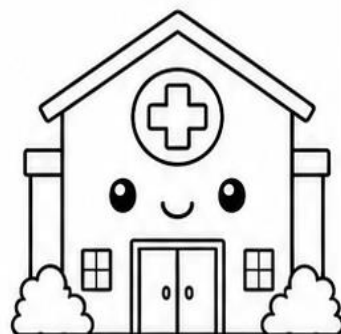
POSTO DE SAÚDE